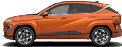
Jupiter Orange Metallic