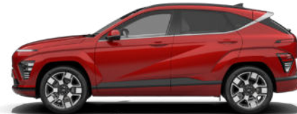
Ultimate Red Metallic