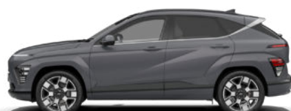
Ecotronic Gray Pearl