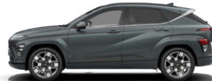
Cypress Green Pearl