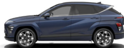
Sailing Blue Pearl