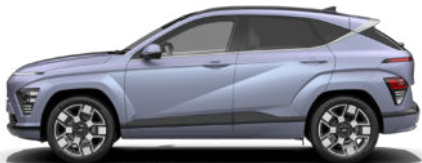
Meta Blue Pearl