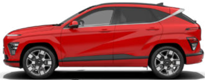
Engine Red Solid