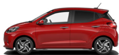
Dragon Red Pearl Kontrastdach verfügbar