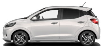
Lumen Gray Pearl Kontrastdach verfügbar