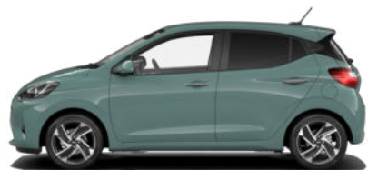
Mangrove Green Pearl Kontrastdach verfügbar