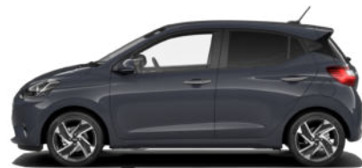
Aurora Gray Pearl