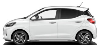
Atlas White Kontrastdach verfügbar