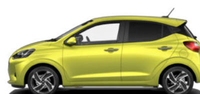
Lucid Lime Metallic Kontrastdach verfügbar