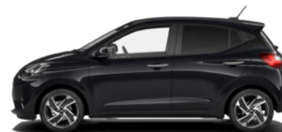
Phantom Black Pearl