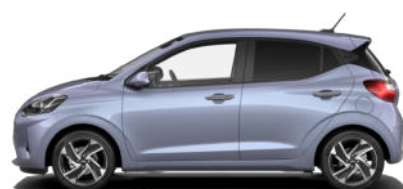
Meta Blue Pearl Kontrastdach verfügbar nicht für N Line