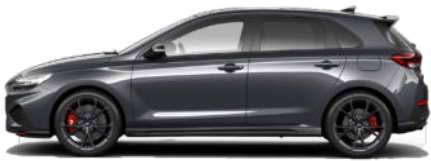
Dark Knight Gray Pearl