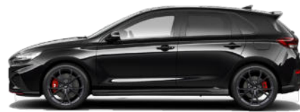
Phantom Black Pearl