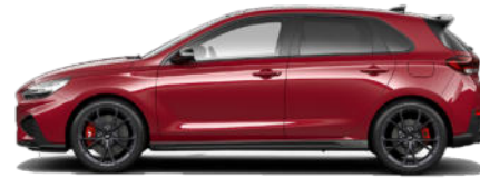
Sunset Red Pearl