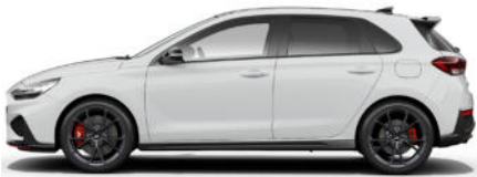
Serenity White Pearl