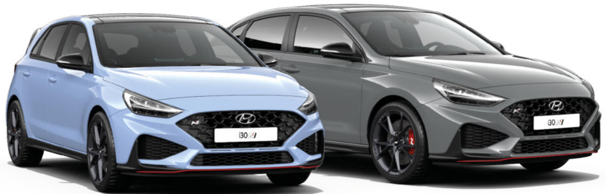
Preisliste November 2022